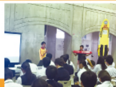
ライフセーブ講習会