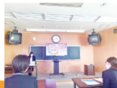
明海大学口唇保健学科講演会