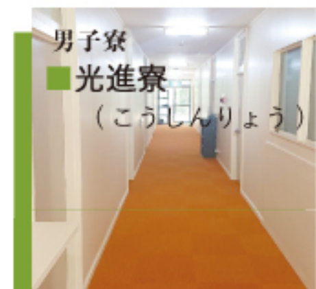
男子寮 ■ 光進寮 (こうしんりょう)