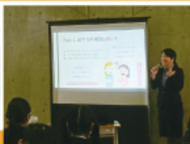
明海大学中国コミュニケーション講演会