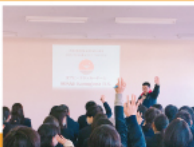
ゾンネ鴨川講演会