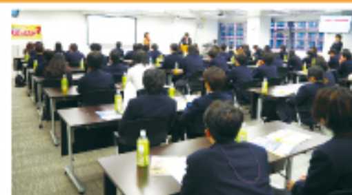
野村ホールディングス