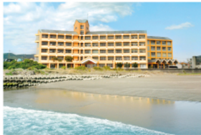
鴨川令徳高等学校