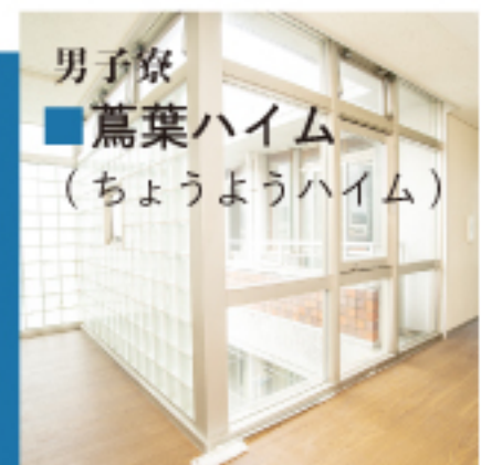
男子寮 ■ 蔦葉ハイム (ちょうようハイム)