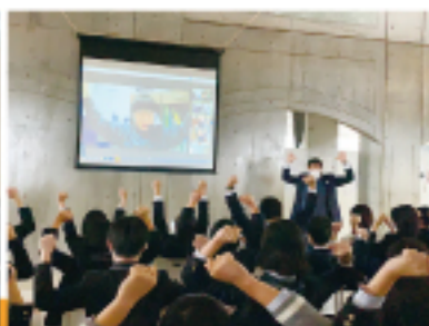
東海大学体育学部講演会