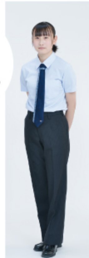
※ネクタイ・スラックスは 男女ともに選択できます