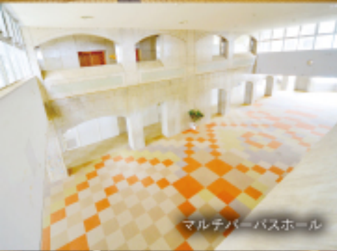
マルチパーパスホール