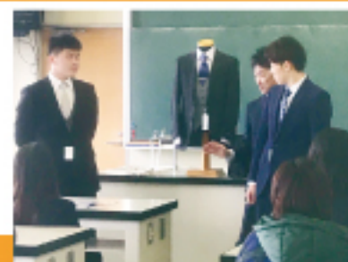
スポーツ着なしセミナー