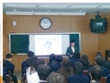
実物乱用防止講演会