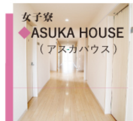
女子寮 ◆ ASUKA HOUSE (アスカハウス)