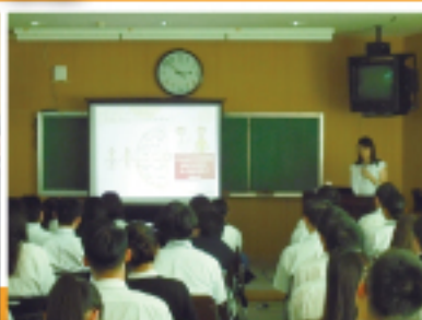
かがやきスクール講演会